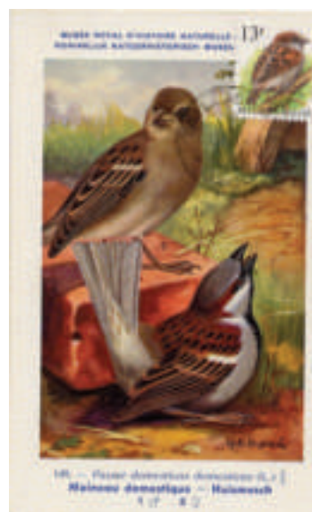
persoonlijke verwezenlijking met kaart van het museum