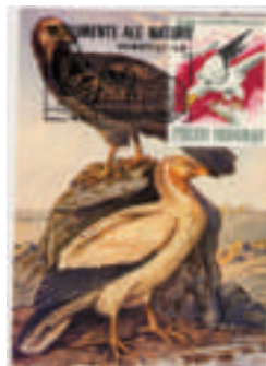
geïllustreerde afstempe- ling