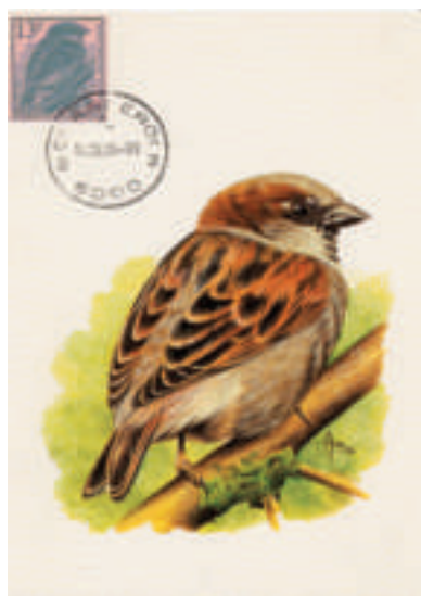
kaart gemaakt met een kaart van Buzin en met een zegel die uit een briefkaart is geknipt

De “richtlijnen voor de aanwending van de reglementen die het mogelijk maken thematische inzendingen te evalueren”, uitgaande van de FIP ( Fédération Internationale de Philatélie ), verduidelijken in artikel 3.2.3. (Het filatelistisch materiaal). ✂