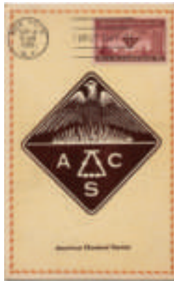
twee "eerstedag" afstempelingen